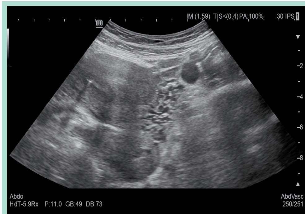
FIGURE 1 : Hitachi Arietta 850, échographie mode B sonde abdominale : visualisation de dilatation du plexus veineux para-utérin.