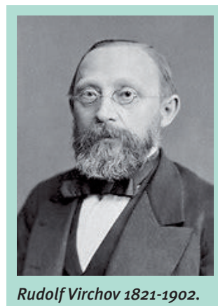
Rudolf Virchow 1821-1902.