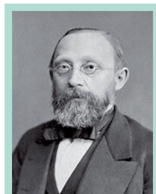
Rudolf Virchow 1821-1902.