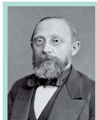
Rudolf Virchow 1821-1902.