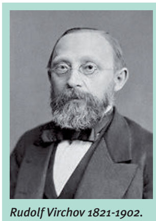
Rudolf Virchow 1821-1902.