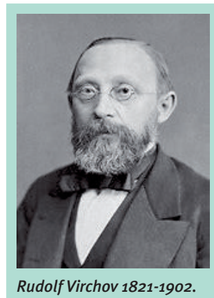
Rudolf Virchow 1821-1902.