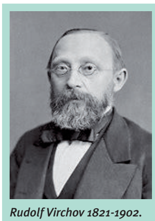
Rudolf Virchow 1821-1902.