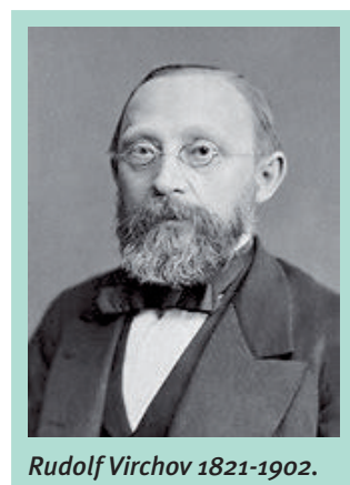
Rudolf Virchow 1821-1902.