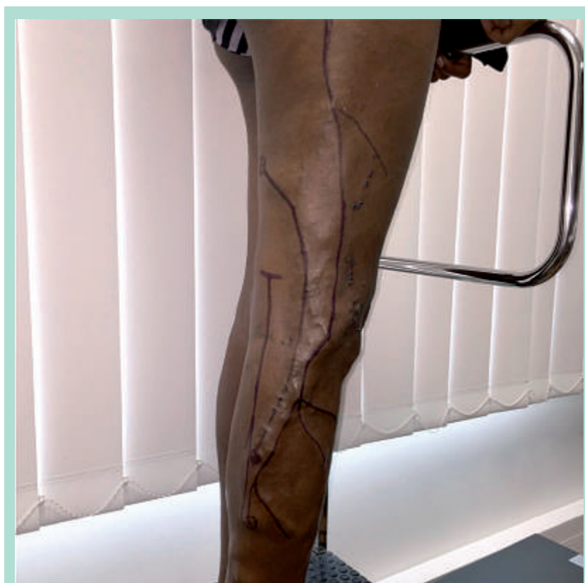
FIGURE 1 : Veine latérale marginale de Servelle systématisée.

L'échographie Doppler haute résolution (SuperSonic Imagine S.A., Aix-en-Provence, France) avec sonde linéaire 18/5 MHz avait permis de cartographier une volumineuse phlébectasie se drainant dans la veine glutéale inférieure, la veine fémorale profonde et la crosse de la saphène externe ( Figure 1 ).