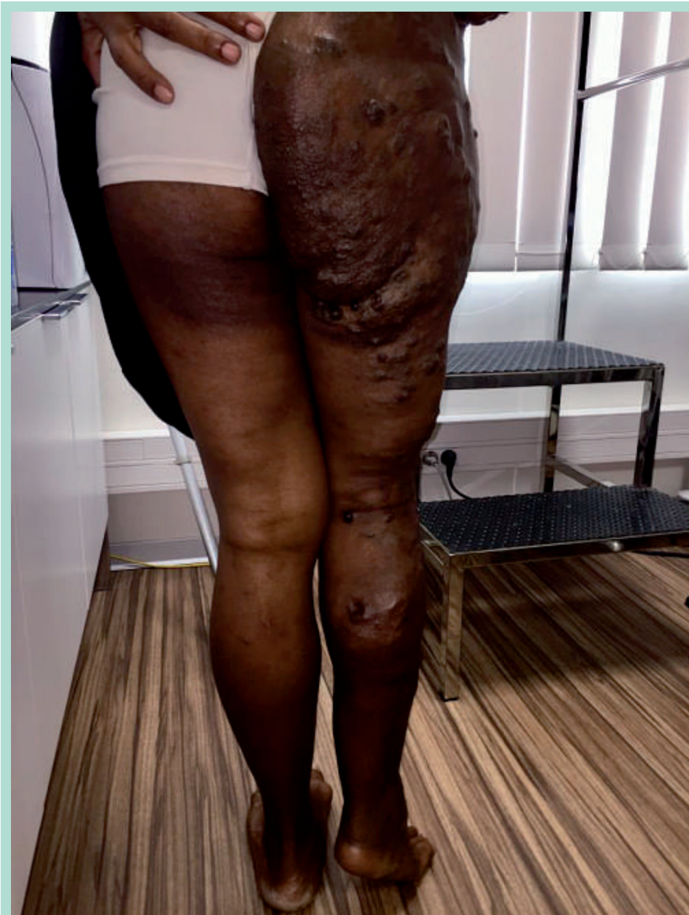
FIGURE 6 : Syndrome angio-ostéo-hypotrophique de Servelle-Martorell.