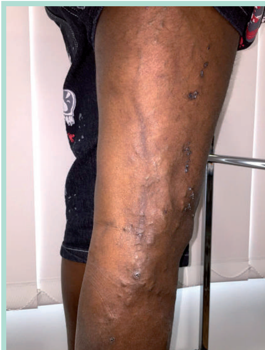
FIGURE 3 : Résultat à 6 mois.

Les examens complémentaires disponibles pertinents seront discutés, ainsi que les traitements.