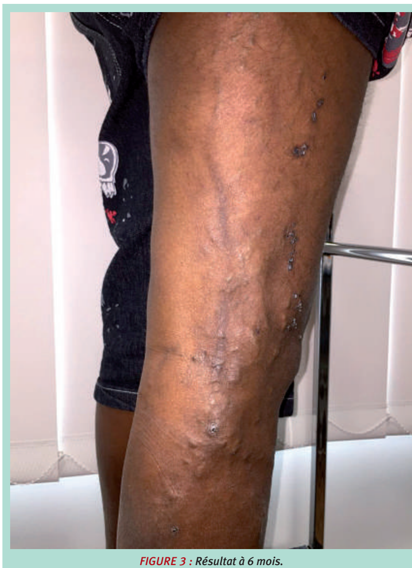
FIGURE 3 : Résultat à 6 mois.

Les examens complémentaires disponibles pertinents seront discutés, ainsi que les traitements.