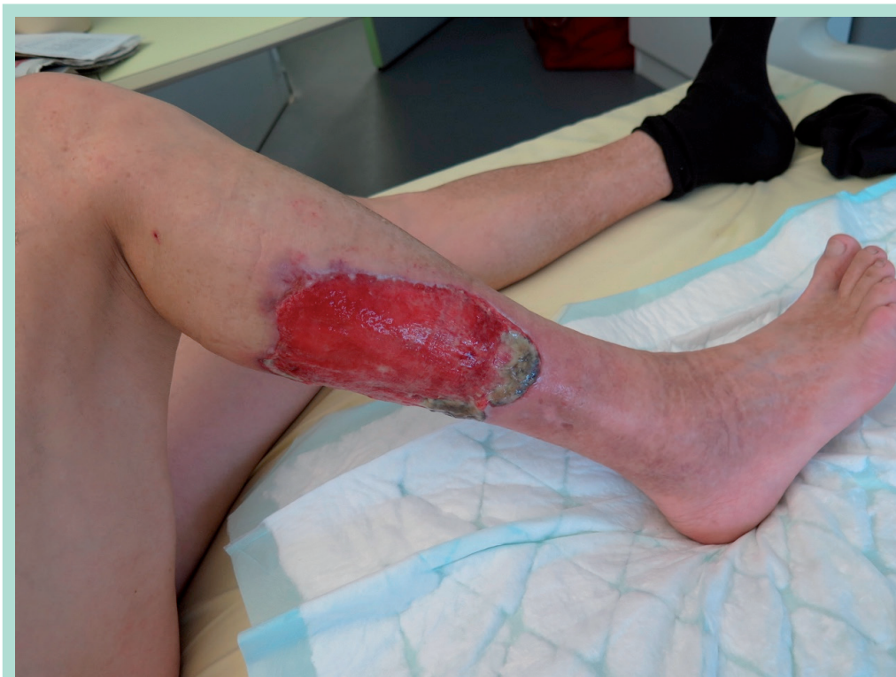
FIGURE 3 : Plaie chronique de M. G. à la prise en charge.