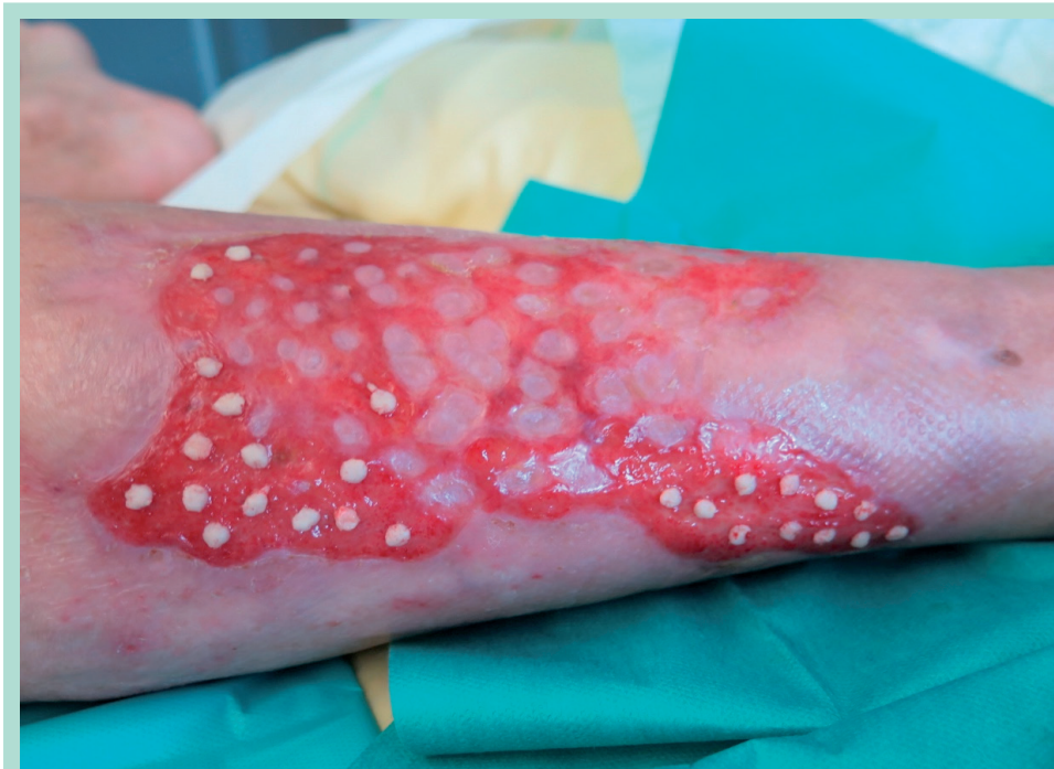
FIGURE 5 : Plaie chronique de M. G. au moment de la 2 e greffe cutanée en pastille.

des artères tibiales postérieures, un système veineux superficiel et profond perméable et continent.