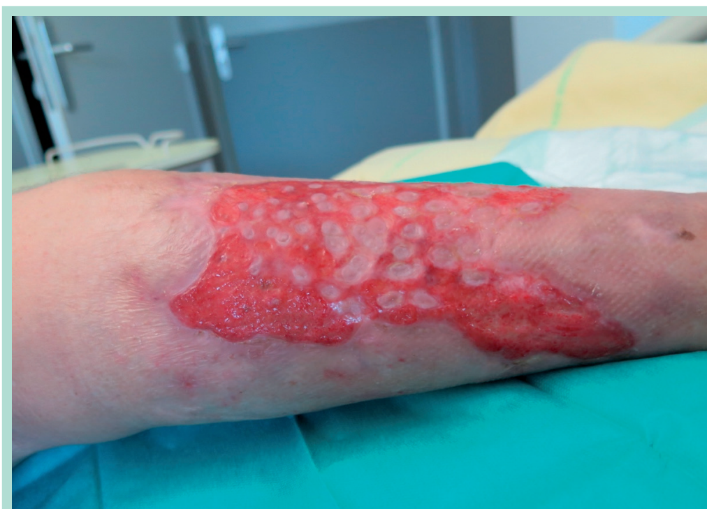
FIGURE 4 : Plaie de M. G. quelques semaines après la 1 re greffe cutanée en pastille.