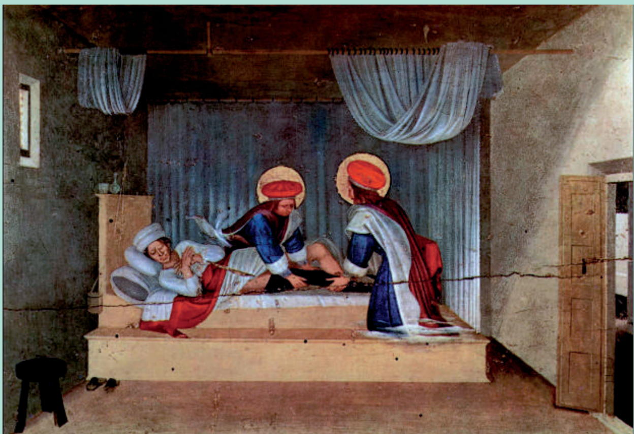
Greffe d'une jambe par les saints Côme et Damien, panneau de la prédelle de la Pala di San Marco de Fra Angelico au Musée national San Marco, Florence.