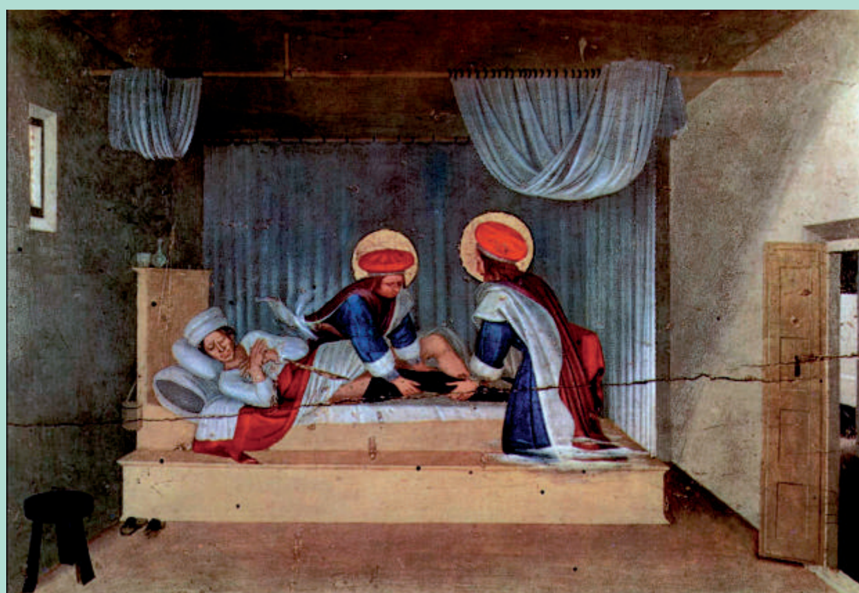
Greffe d'une jambe par les saints Côme et Damien, panneau de la prédelle de la Pala di San Marco de Fra Angelico au Musée national San Marco, Florence.