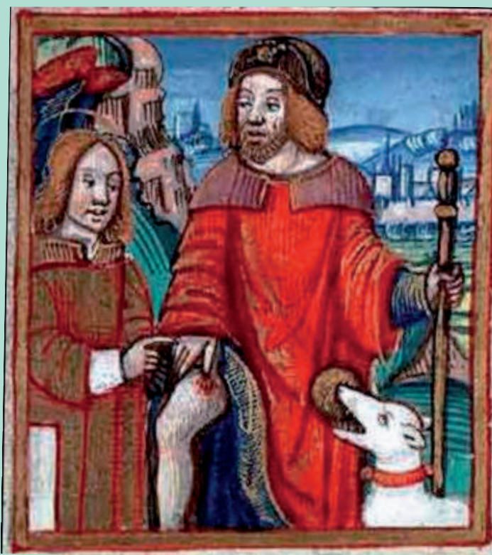
Saint Roch de Montpellier, montrant son bubon.