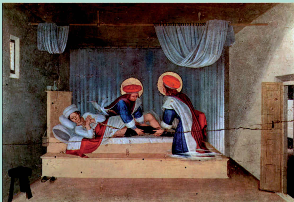
Greffe d'une jambe par les saints Côme et Damien, panneau de la prédelle de la Pala di San Marco de Fra Angelico au Musée national San Marco, Florence.